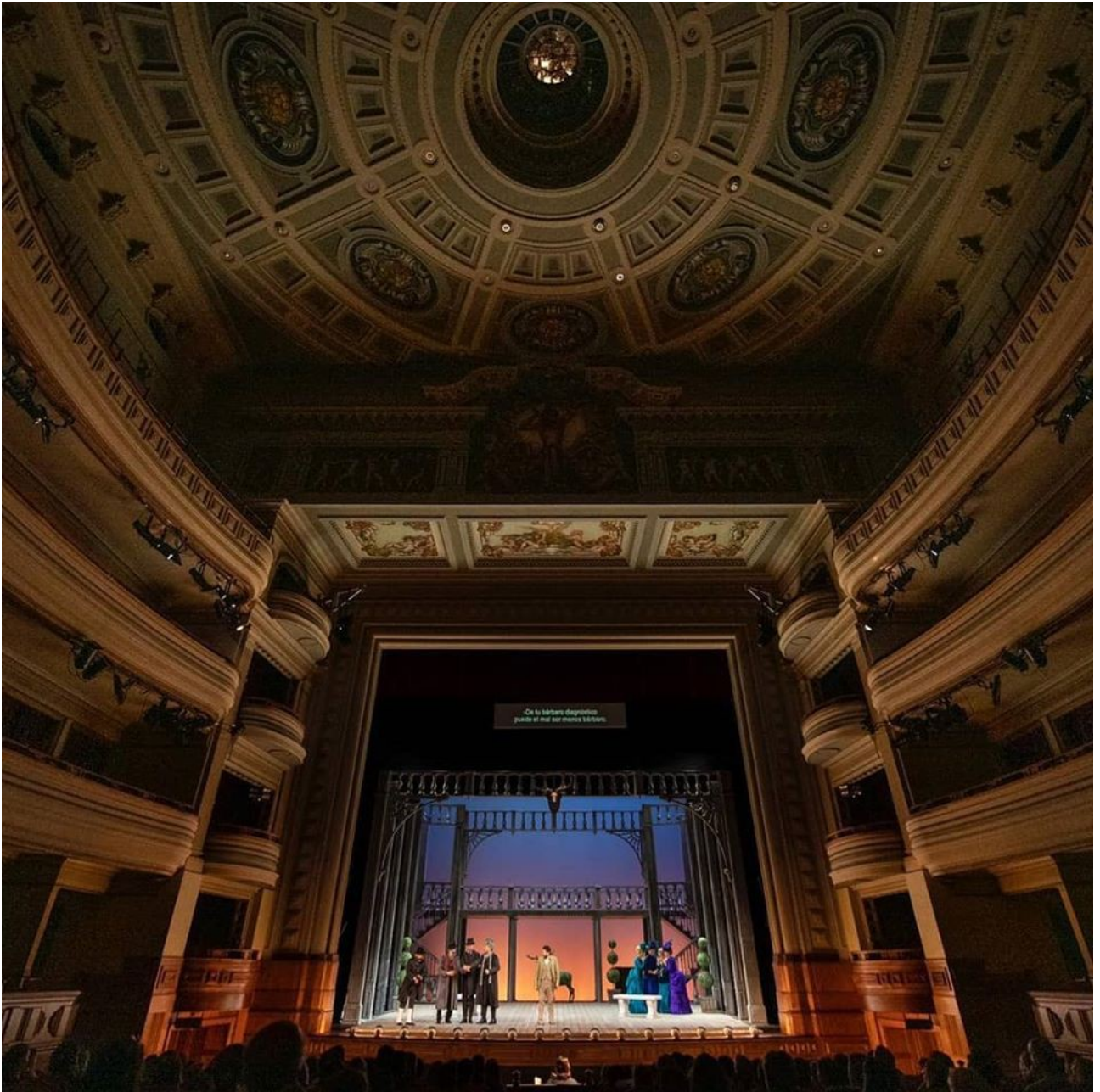
Falstaff – Las Palmas 2020